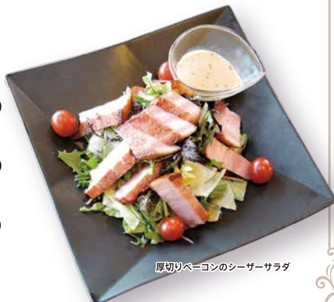
厚切りベーコンのシーザーサラダ