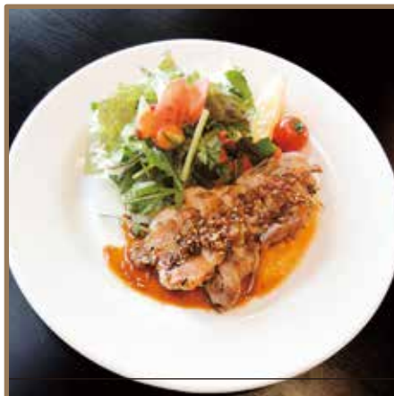
若鶏のガーリックグリル