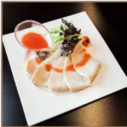
塩豚のあぶり焼き