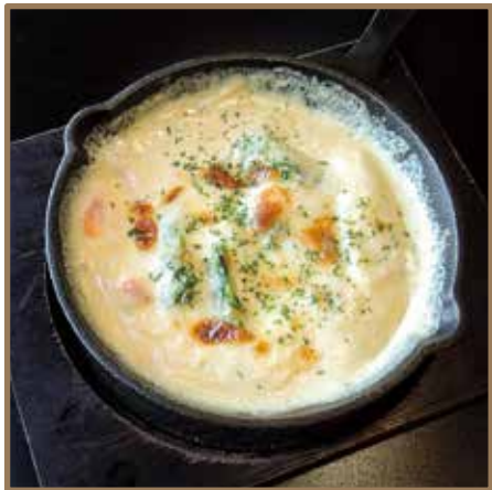
白姫海老とブロッコリーの チーズグラタン