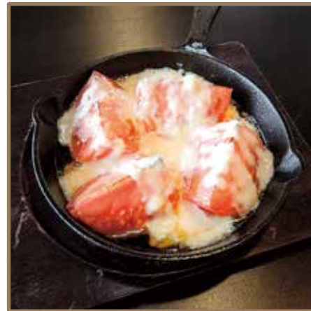
丸ごとトマトのチーズ焼き