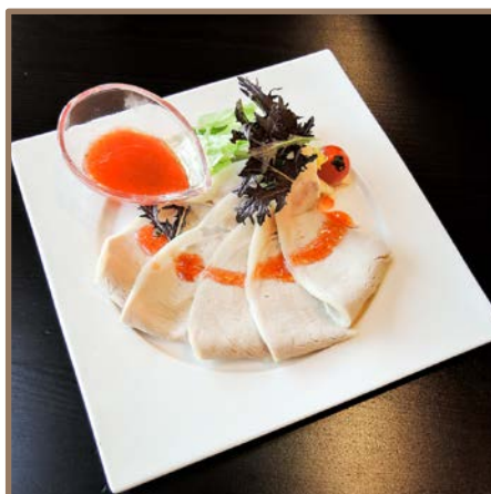
塩豚のあぶり焼き