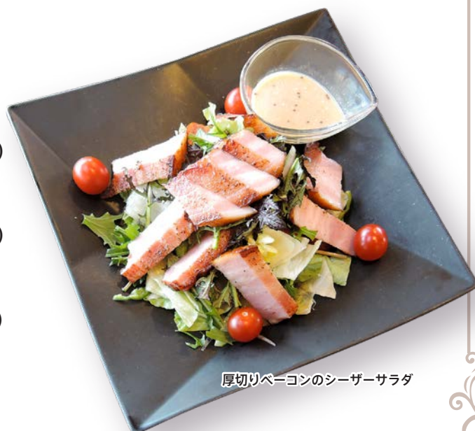
厚切りベーコンのシーザーサラダ