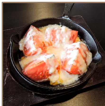
丸ごとトマトのチーズ焼き