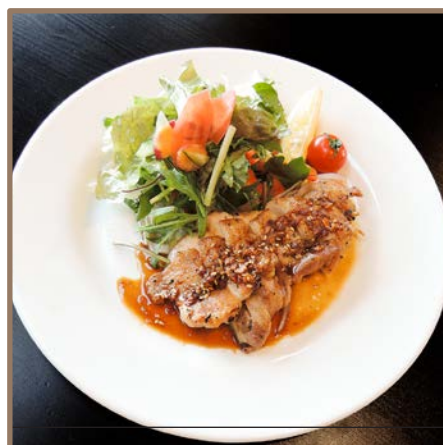
若鶏のガーリックグリル