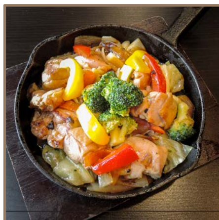
若鶏のオイスターソース焼き